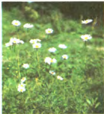
632. Королиця звичайна.